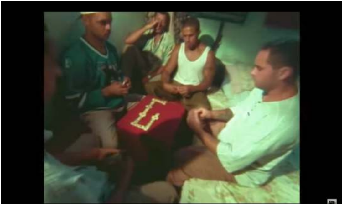
Figura 13 – Mano Brown em cena do videoclipe Diário de um Detento