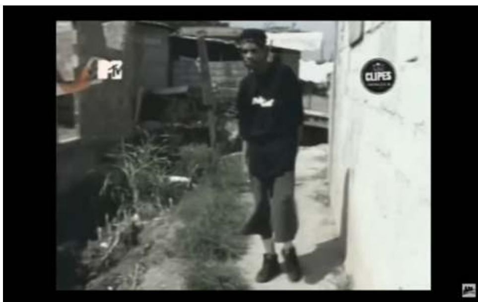
Figur 12 - Cena do videoclipe do grupo Sistema Negro, Cada um por si