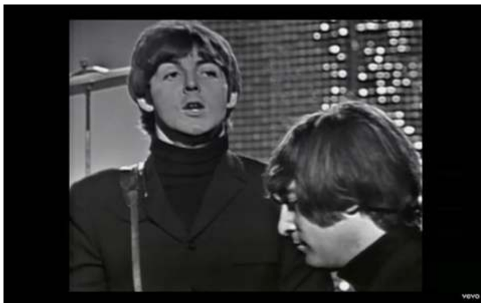
Figura 8 - Paul McCartney e John Lennon no videoclipe We Can Work it out