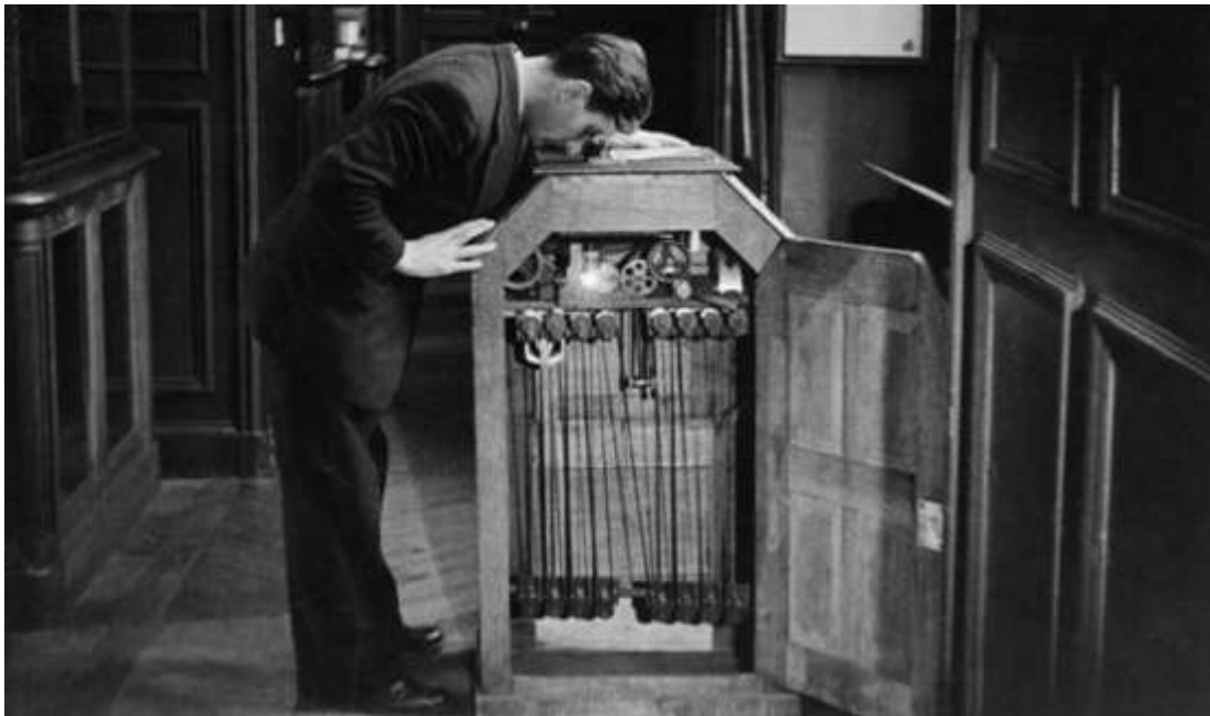
Figura 6- Utilização do primeiro Cinetoscópio