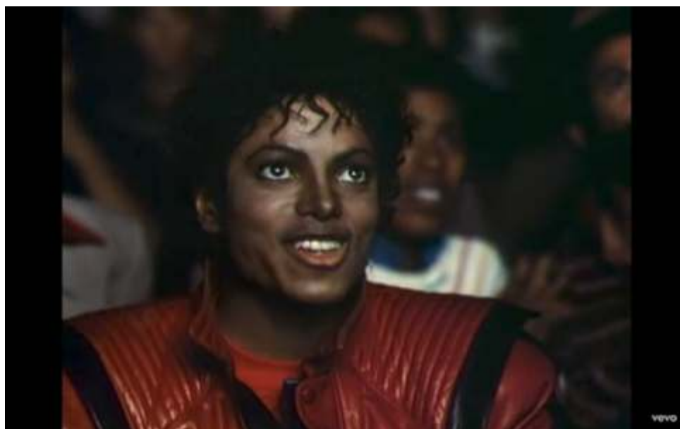
Figura 10 – Michael Jackson atuando no videoclipe de Thriller