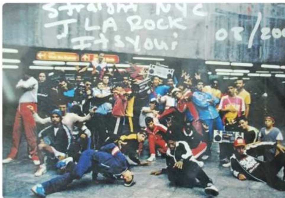
Figura 1 – B.boys na frente da São Bento