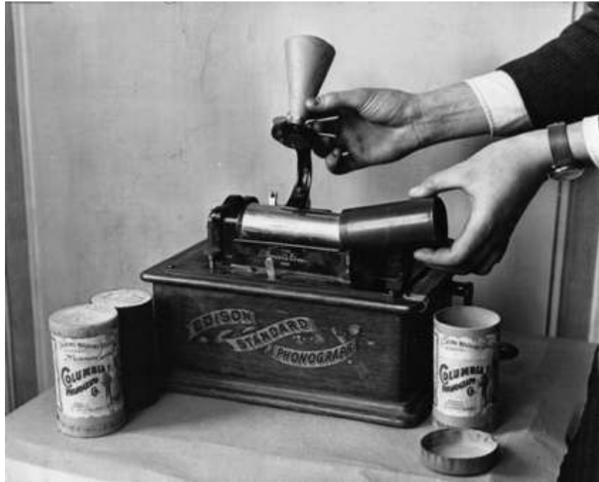
Figura 5 – Demonstração do Fonógrafo