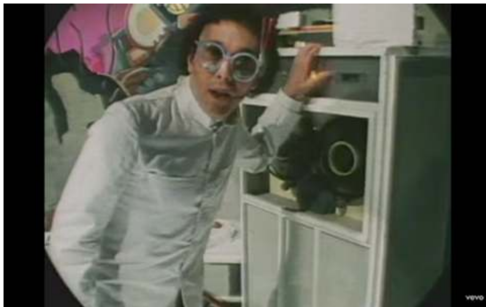
Figura 9 – Banda The Buggles, no primeiro videoclipe transmitido pela MTV