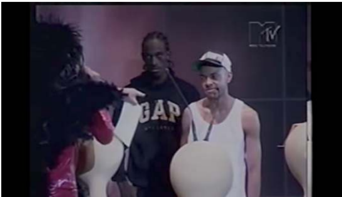
Figura 14 - Carlinhos Brown interrompe o discurso de KL Jay no VMB 98