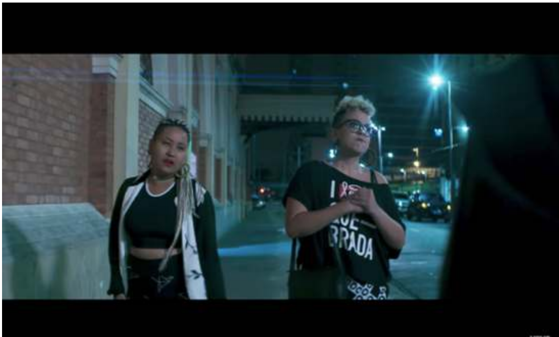
Figura 15 – Cena de Mandume na qual duas meninas brigam com os rapazes que mexeram as meninas