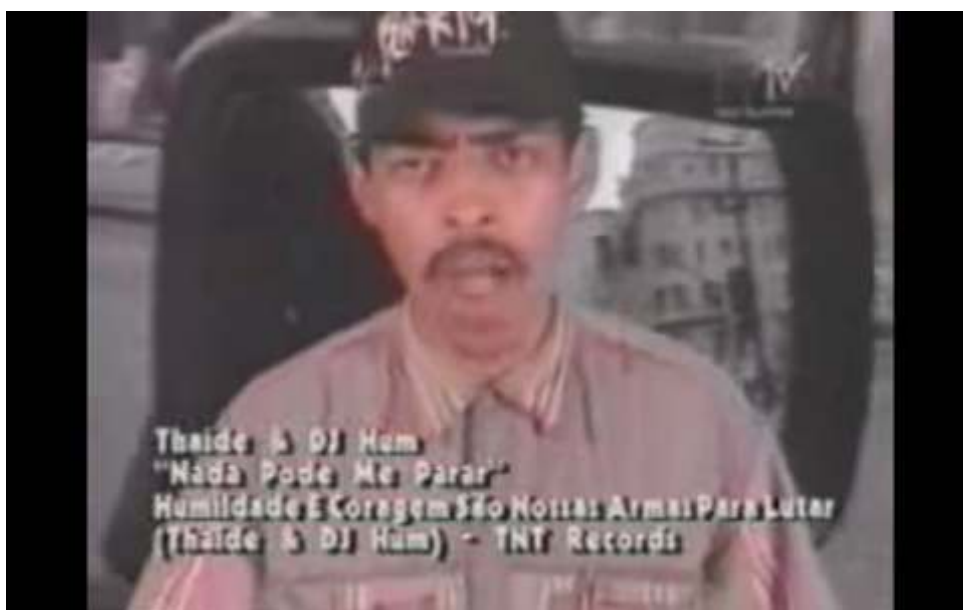
Figura 11 – Thaíde em cena do videoclipe Nada Pode me Parar