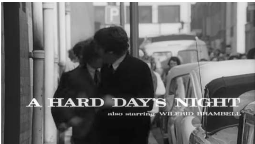
Figura 7 – Cena inicial do filme A Hard Day's Night