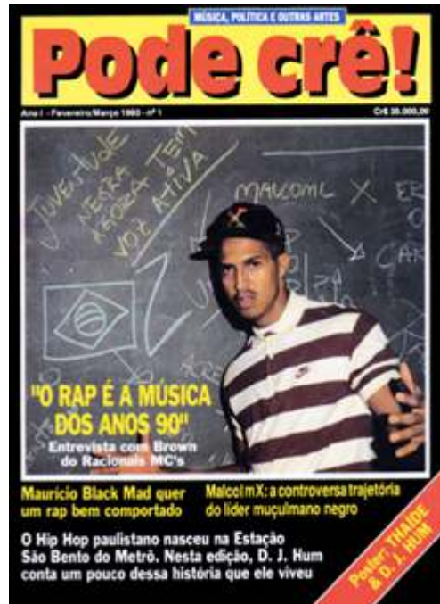
Figura 3 – Primeira Edição da Revista Pode Crê! com Mano Brown na capa