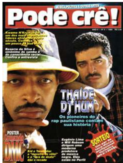
Figura 4 – Quarta Edição da Revista Pode Crê! com Thaíde e DJ Hum na capa.